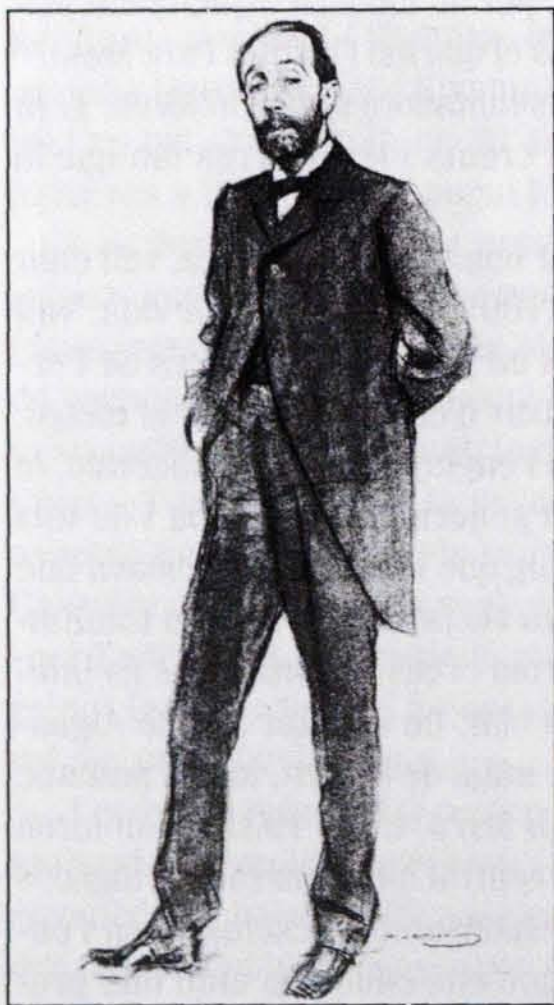
Figura 58. - L'acció sanitària i social de Bartomeu Robert (1842-1902) com a alcalde de Barcelona fou el tema d'una conferència de l'Onzè Congrés (En un retrat de Ramon Casas)